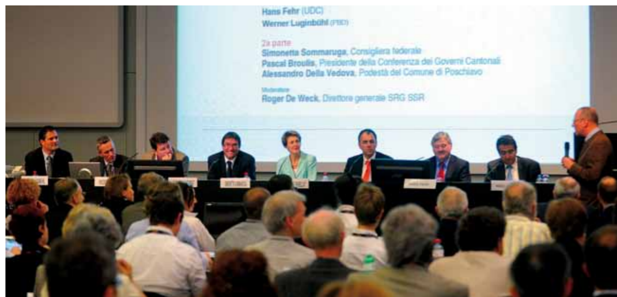
La troisième Conférence nationale sur le fédéralisme s'est déroulée en mai 2011 à Mendrisio en présence de la Conseillère fédérale Simonetta Sommaruga, du Président de la Conférence des gouvernements cantonaux et des milieux politiques et économiques, du monde de la recherche et de l'administration.