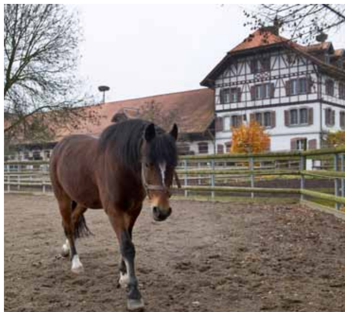
Le Conseil fédéral proposera une modification de la loi sur l'agriculture, qui engage la Confédération à exploiter un haras national tout en assurant durablement son financement.