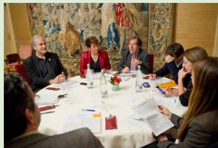
Membres de la députation vaudoise: Olivier Feller, Christian van Singer, Josiane Aubert, Eric Voruz, Ada Marra, Roger Nordmann et Adèle Thorens Goumaz.