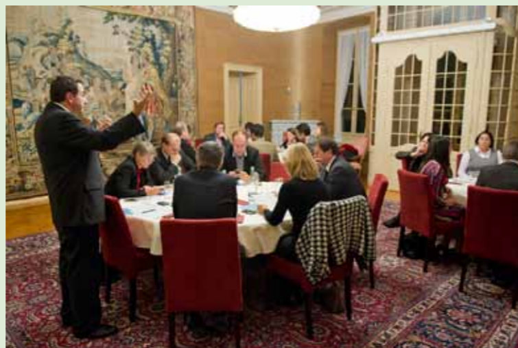
Le Conseil d'Etat et la députation vaudoise aux Chambres fédérales étaient réunis le 23 novembre à la Maison de l'Elysée pour marquer le début de la nouvelle législature.

Depuis 2010, une rencontre annuelle est organisée avec les «Vaudois de Berne» dont le nombre a progressé d'une année à l'autre. Parmi les thèmes abordés, celui du faible nombre de Romands et de Vaudois en particulier dans les hautes sphères de l'administration fédérale. Selon une récente étude, seuls dix Romands et trois Tessinois figurent parmi les septante cadres de l'administration en contact direct avec un Conseiller fédéral.