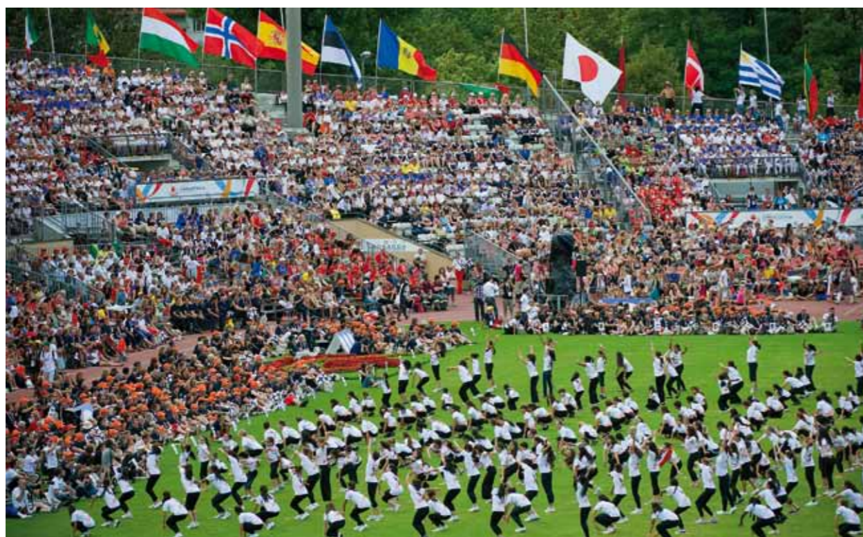
Ce ne sont pas moins de 19'000 gymnastes qui ont participé à la 14 e édition du World Gymnaestrada en juillet 2011 à Lausanne.

Pas moins de 19'000 gymnastes en provenance de 55 pays ont participé à la 14 e World Gymnaestrada en juillet 2011 à Lausanne. Ils étaient accompagnés et entourés par quelque 4'300 bénévoles. Pendant une semaine, la ville de Lausanne a vécu au rythme de la gymnastique pour tous. Du stade olympique de la Pontaise au centre sportif de Malley, en passant par Beaulieu Lausanne et Bellerive, les différents sites de la manifestation ont permis à un public nombreux de se retrouver pour admirer les multiples productions sportives et musicales.