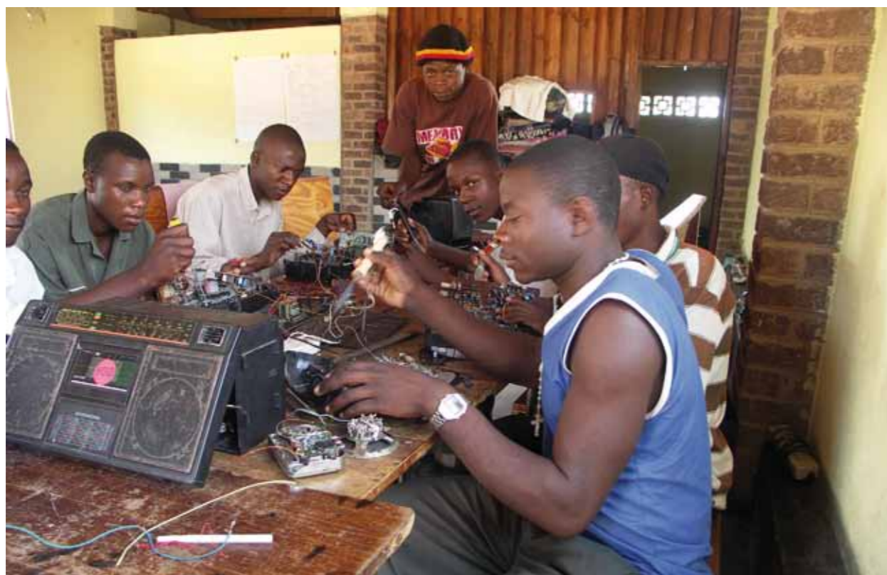
L'Etat de Vaud finance par le biais de la Fédération vaudoise de coopération des projets portés par des associations locales. En l'occurrence, un projet de formation de l'Entraide protestante (EPEP) au Sénégal.

Le département soutient également des projets proposant des alternatives aux producteurs de plantes servant à la fabrication de stupéfiants (projet d'Action de Carême en Colombie). Par ailleurs, une conférence annuelle ouverte au public permet de sensibiliser la population sur un sujet lié aux projets financés. En 2011, elle a permis d'établir un regard croisé entre les déséquilibres alimentaires du Sud et de l'Occident, en partant du projet «Nepal nutrition programme» de Terres des Hommes.