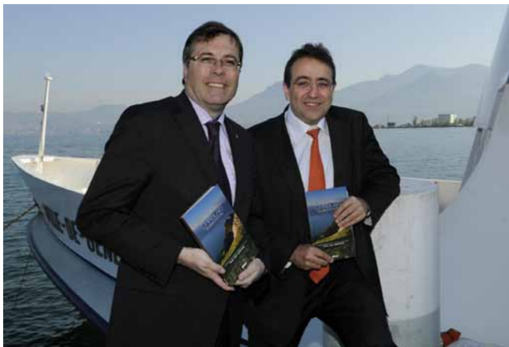
Présidents des gouvernements valaisan et vaudois, Jean-Michel Cina et Pascal Broulis lancent le guide des «3 Chablais».

La région du Chablais connaît l'une des plus fortes croissances de Suisse. Son dynamisme démographique (entre 2000 et 2010 : + 17 % d'habitants), s'explique notamment par sa position stratégique entre l'Arc lémanique et les Alpes valaisannes et vaudoises, sa bonne desserte routière