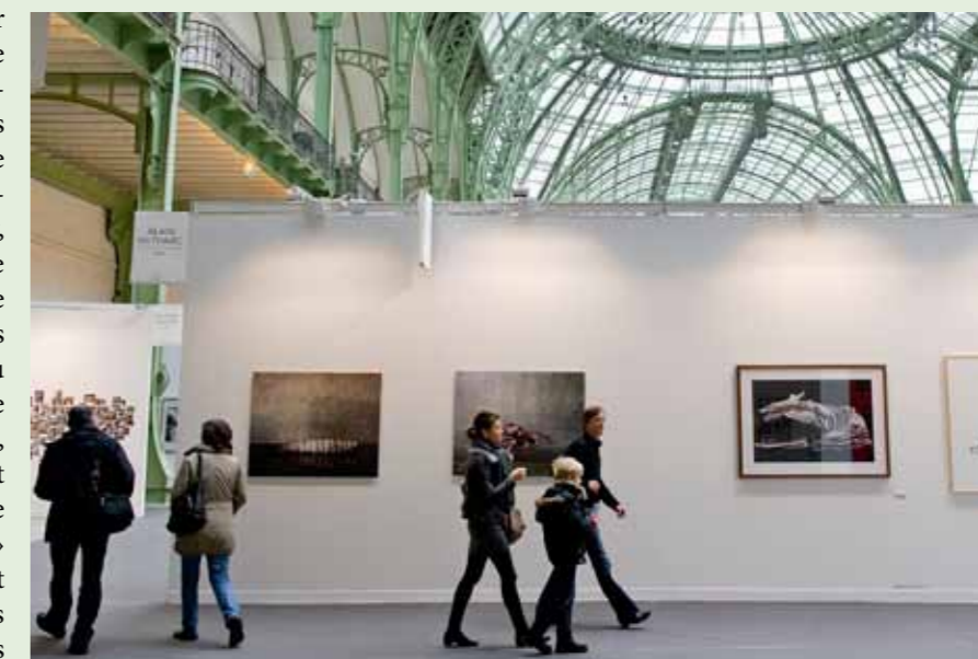
Avec la Tate Modern de Londres et le International Center of Photography de New York, le Musée de l'Elysée était l'un des trois invités du Salon Paris Photo 2011, qui a accueilli plus de 51'000 visiteurs en quatre jours.

La culture vaudoise était à l'honneur de la scène parisienne. Le Musée de l'Elysée était l'une des trois institutions invitées du Salon Paris Photo 2011, aux côtés de la Tate Modern, de Londres, et de l'International Center of Photography, de New York. Parallèlement, une exposition conçue à l'origine par le Musée de design et d'arts appliqués contemporains était présentée au Musée des arts décoratifs. La cheffe du Département de la formation, de la jeunesse et de la culture s'est rendue à Paris pour présenter le projet «Plate-forme, pôle muséal» lors de rencontres avec la presse et de ses multiples contacts avec des représentants des milieux culturels français, mais aussi du Centre culturel suisse.