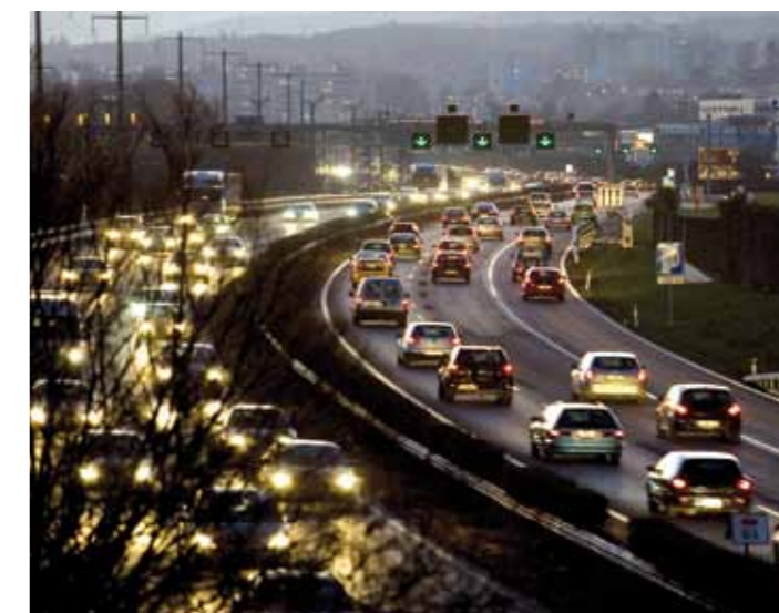
L'Office fédéral des routes a identifié Morges comme l'un des points noirs du réseau.

résultats d'une étude d'opportunité, comprenant plusieurs variantes de liaisons autoroutières. Outre une variante de base qui prévoit d'améliorer la liaison autoroutière existante, la création de liaisons supplémentaires est envisagée, elles sont classées en trois catégories: des liaisons courtes qui dédoublent le tronçon autoroutier existant; des liaisons longues, qui relient l'Ouest de Morges au secteur de Villars Sainte-Croix et enfin des liaisons mixtes, résultant de la combinaison des liaisons longues et courtes. L'examen de ces variantes est en cours. A l'issue de cette réflexion, une variante optimale sera proposée, qui intégrera au mieux les exigences fédérales, cantonales et communales. A noter que le dossier du contournement autoroutier de Genève avec le projet de traversée du Lac fait également l'objet d'études de la part de l'Office fédéral des routes.